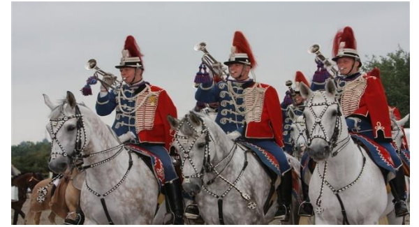
Irak 2005 & 2007